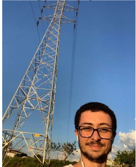
Figura 3 – Treliça espacial