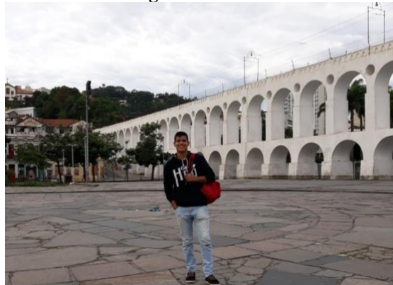
Figura 4 – Arcos