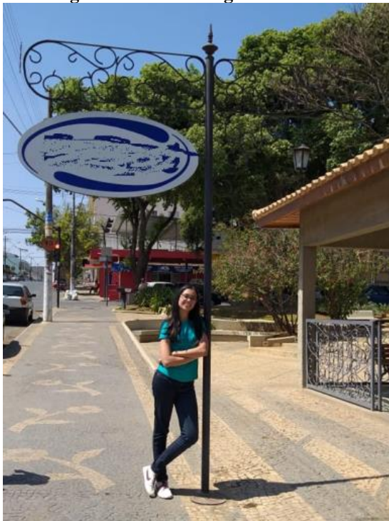
Figura 2 – Pórtico engastado e livre