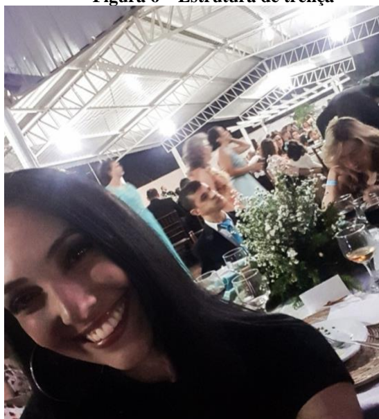
Figura 6 – Estrutura de treliça

A motivação dos estudantes em fotografar estruturas que se enquadravam no que havia sido estudado foi notória. A variedade de situações em que as fotos foram criadas se mostrou ampla. A foto a seguir (Figura 6) é um exemplo dessa situação. A aluna tirou a fotografia em um momento de uma festa da qual ela participava, ou seja, a correlação entre o que se estudou e a vida “real” foi perfeitamente estabelecida.