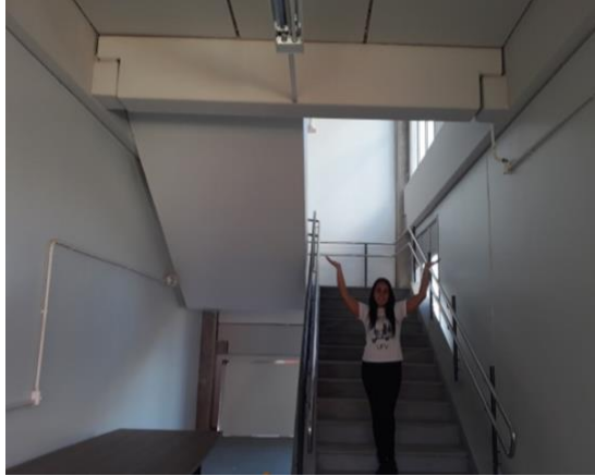
Figura 1 – Viga Biapoiada

conteúdo da primeira prova; ou seja, vigas e pórticos. Já a Figura 3, a Figura 4 e a Figura 5 exemplificam a situação de fotos referentes às matérias da segunda e terceira provas (treliças, arcos e grelhas).