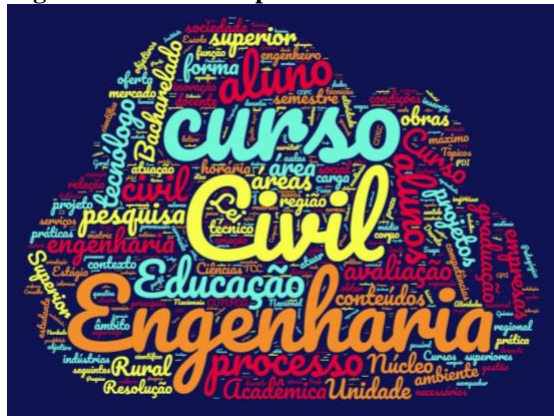
Figura 3 – Nuvem de palavras do PPC analisado

Além do processo de análise à luz de Bardin (2011), foi utilizado o software Wordclouds para analisar a frequência das palavras no PPC (UFXX, 2019). Chegou-se a uma síntese constituída por 682 palavras. O resultado, ilustrado na nuvem representada na Figura 3, permite a visualização de alguns aspectos importantes dessa análise.